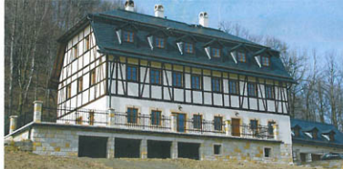
▲ Areál Rozhled v Jiřetíně pod Jedlovou