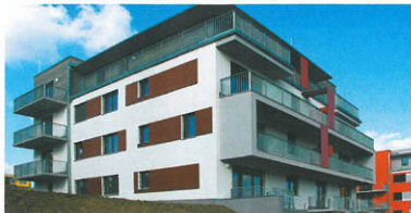
▲ Obytný soubor Milíčkovský háj