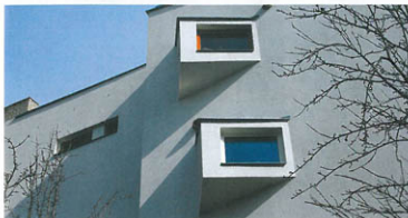
▲ Bytový dům Kladenská