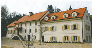
▲ Rohlovský mlýn