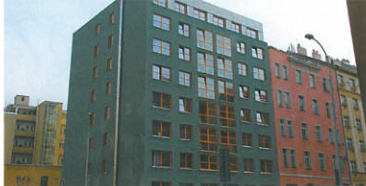
▲ Panelový dům Sudoměřská