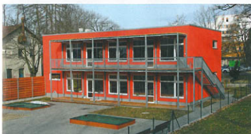
▲ Sloučené zařízení MS a jesli v Jablonci nad Nisou